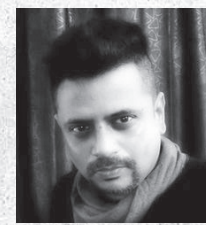
शिवव्याख्याते किमंतु ऑंबळे-सरकार