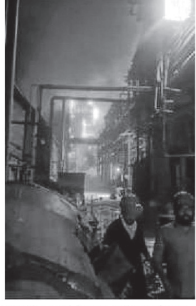
Smoke and flame billows from the chemical factory in the Sachin GIDC area of Surat where the fire broke out.

The National Human Rights Commission (NHRC) on Monday issued notice to the Chief Secretary and the Director General of Police, Gujarat, calling for a detailed report of the incident in which seven workers died and 24 got injured after a massive blast at a chemical manufacturing factory in Sachin GIDC area of Surat.